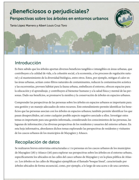
Ejemplo de una hoja informativa

Se presentan diversas definiciones de lo que constituye un bosque urbano. Además, se describen los distintos tipos de bosques urbanos según su configuración en el paisaje. Finalmente, se incluye un listado de los beneficios que estos aportan.